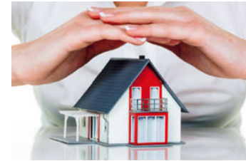
Seite 8: Wichtige Versicher- ungen für die Bauzeit