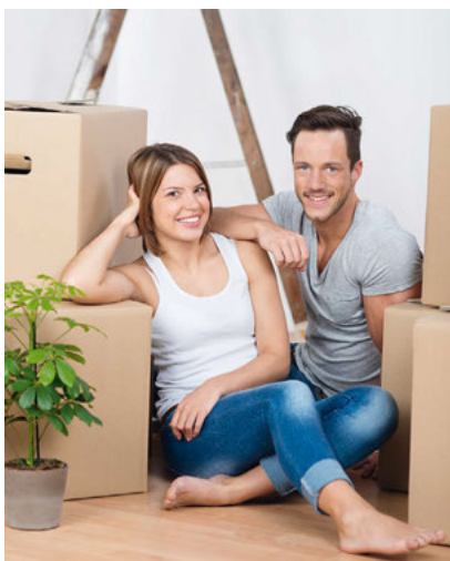
Großer Glücksmoment laut Studie: Der Einzug in die eigene Immobilie.

keren Bindung an das soziale Umfeld und spiegle sich beispielsweise im gesellschaftlichen Engagement wider. Der ehrenamtliche Einsatz bei der Freiwilligen Feuerwehr, beim Sport oder in der Kirche sei größer als der der Mieter. Als größte Glücksmomente geben Eigenheimbesitzer in der Studie den Moment der Entscheidung für den Kauf, den Einzug und die Zahlung der letzten Rate an. Kaum ein Glück ist jedoch von Dauer. Auch das bestätigt die Studie. Als größten Glücksdämpfer empfinden die meisten Befragten demnach den Auszug der Kinder.