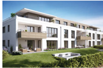
Seite 4: VITANO Gundelfingen – Das Leben lieben