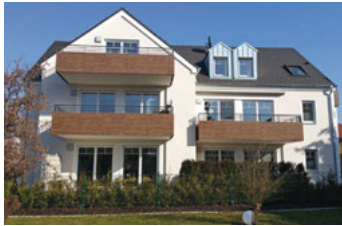
Seite 2: ULRICHS- PALAIS Tapfheim – Stilvoll leben